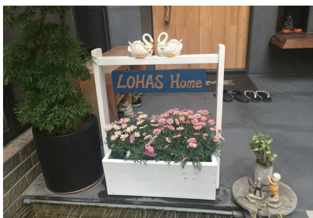
2020 年 木工—樂活花植