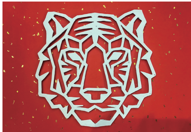
2022 年 剪紙—福虎生豐