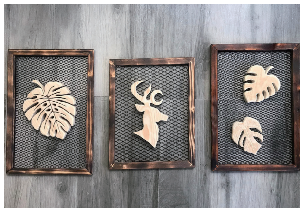
2021 年 木刻—壁飾