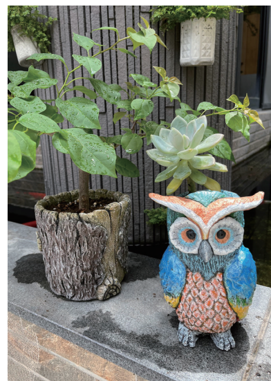
2022 年 水泥—貓頭鷹與樹椿