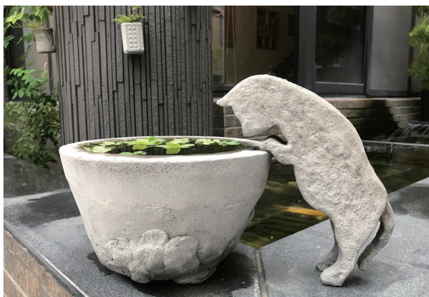
2020 年 水泥—鄰居的貓