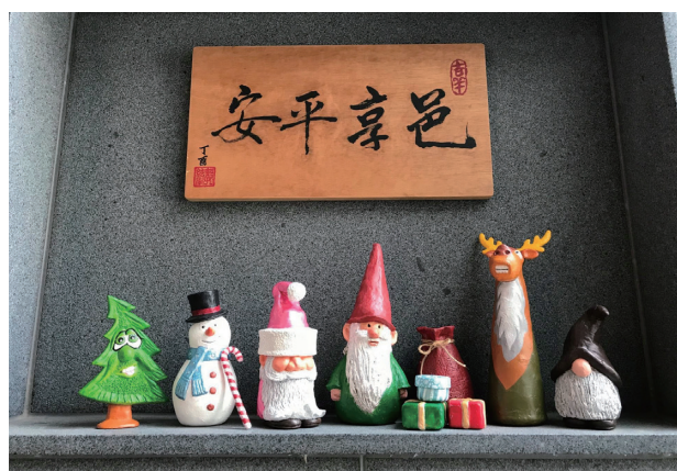
2020 年 聖誕嘉年華