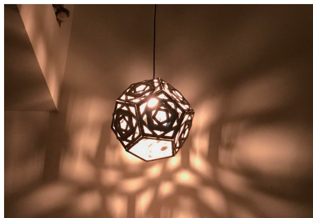
2019 年 瓦楞紙一吊燈