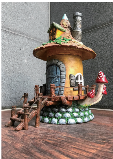
2020 年 紙黏土—童話屋夜燈