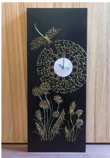
2021 年 膠彩—壁鐘掛飾