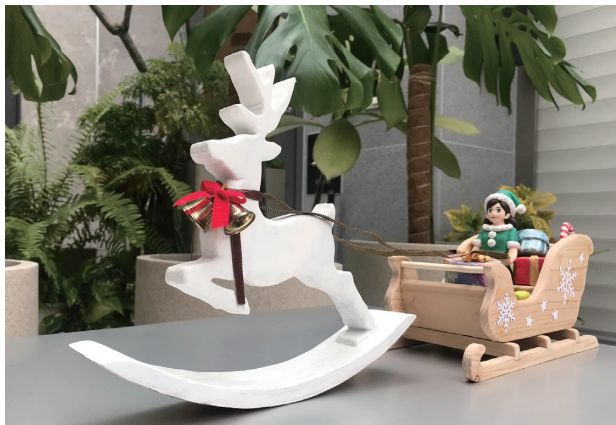
2021 年 木作—歡樂耶誕